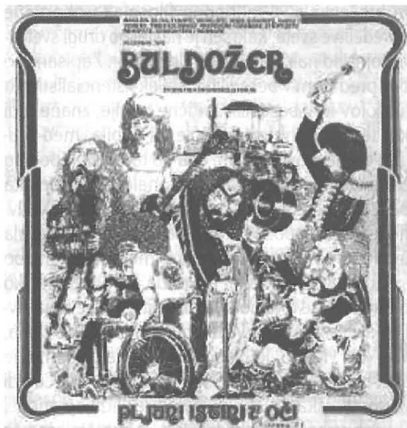
Slika 1: Slovenska rockovska skupina Buldožerji: LP Pljuni istini u oči. Plošča, ki je izšla leta 1975 in postala kmalu kulturna, je na drugi strani zaradi socialnega naboja besedil, zapetih v srbohvrvaščini, povzročila val pritiskov in groženj pri oblasteh.

kot je jasno, denimo, kaj je pomenilo l. 1848, ki je trdno določilo pojem naroda v evropsko kolektivno pamet in nespamet.