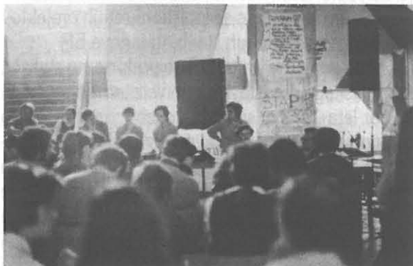
Ljubljana, junij 1971: Avla FF – osrednje prizorišče zasedene FF (fotograf neznan, v: Študentsko gibanje 1968–1972, 1982, priloga)

reformo univerze. Za leto 1968 je osrednji dogodek zborovanje v študentskem naselju 6. 6., za leto 1971 pa zasedba Filozofske fakultete Univerze v Ljubljani (25. 5. do 3. 6. 1971). Opisana so tudi prizadevanja študentov FF, EF in nekaterih drugih strok za izboljšanje študija v letu 1971 in v začetku 1972. Ugotavlja, da so študenti v tem času opozarjali na probleme takratne družbe in univerze, na primer na socialno razlikovanje, neustrezen položaj izobraževanja in znanosti ter zastarel način študija. Oblikovali so bolj ali manj konkretne predloge za izboljšanje svojega socialnega položaja in modernizacijo študija ter nekatere predloge tudi uveljavili. Končuje z ugotovitvijo, da je bil najpomembnejši rezultat gibanj na ljubljanski univerzi v tistih letih oblikovanje osebnosti dejavnejšega dela takratnih generacij slovenske mladine.