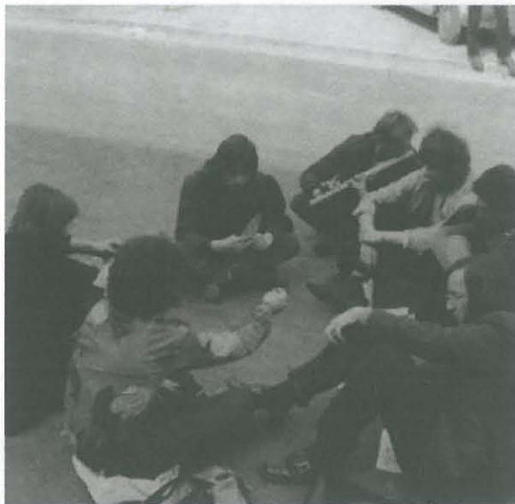
Foto 3: »Sit-in na Aškerčevi.« »Sit-in« ali »down-in« so znana oblika nenasilnega protesta študentov iz šestdesetih in sedemdesetih. Študentje so se usedli na sredo ceste in tako izražali svoje nestrinjanje z vladajočo politiko. Ob tem so večinoma prepevali protestne pesmi (Joan Baez, Bob Dylan). Za demonstracije na Aškerčevi je značilno tudi igranje šaha na cesti. Začelo se je s študentskimi upori proti vietnamski vojni v ZDA, od tod tudi angleški izraz, ki je v družboslovni literaturi ustaljen termin in se ne prevaja. (Foto: Žare Veselič. Fotoarhiv Mestnega muzeja Ljubljana)

Slika 2: Delovna miza v prvi urbani komuni v Sloveniji G7 v Tacnu, 1971. (Foto: Žare Veselič. Fotoarhiv Mestnega muzeja Ljubljana)