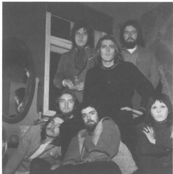
Foto 5: Tacen. Leta 1971 je bila ustanovljena tudi prva slovenska urbana komuna. V Sloveniji je močno odmevalo gibanje nizozemskih kobouterjev, palčkov, začetnikov porajajoče se ekološke zavesti v Evropi. Njeni člani so redno obiskovali komuno v Tacnu, tako kot tudi drugi potujoči študentje iz Evrope. Eden izmed njih (na sliki v sredini spodaj) je danes slavni irski glasbenik in kantavtor, Andy Irvine. Svojemu bivanju v Ljubljani, v Tacnu je posvetil pesem Autumn Gold na zgoščeni Rain on the Roof.