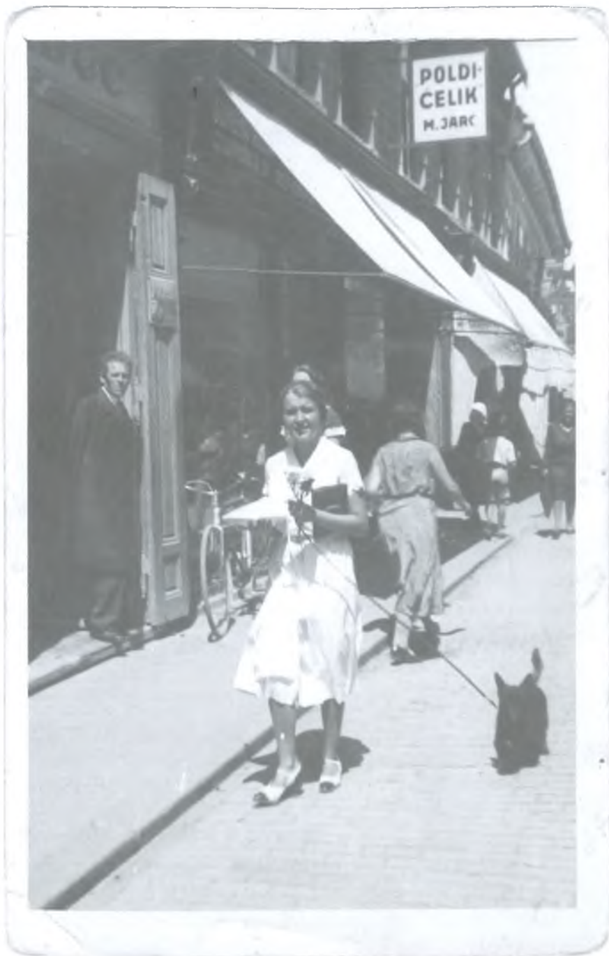
Mariborčanka na fotografiji brzoslukača iz obdobja med obema vojnama