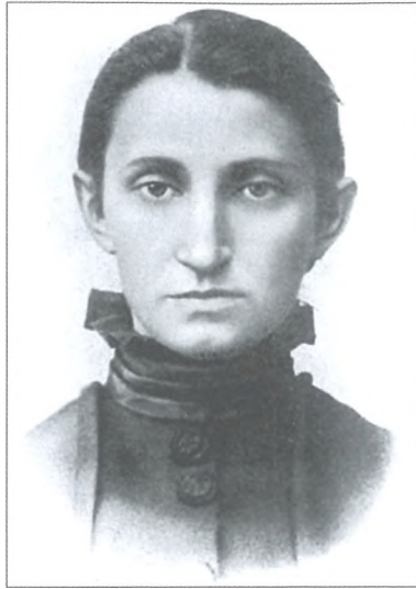
Olga Kobylanska leta 1899