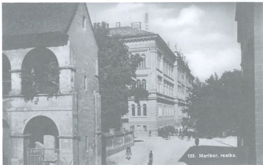
Realna gimnazija Maribor in njeni dijaki leta 1930