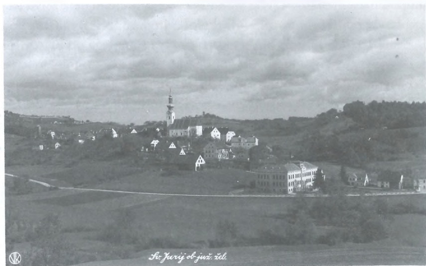
Šentjur, trideseta leta 20. stoletja (PAM, Zbirka fotografij in razglednic, inv. 1368)