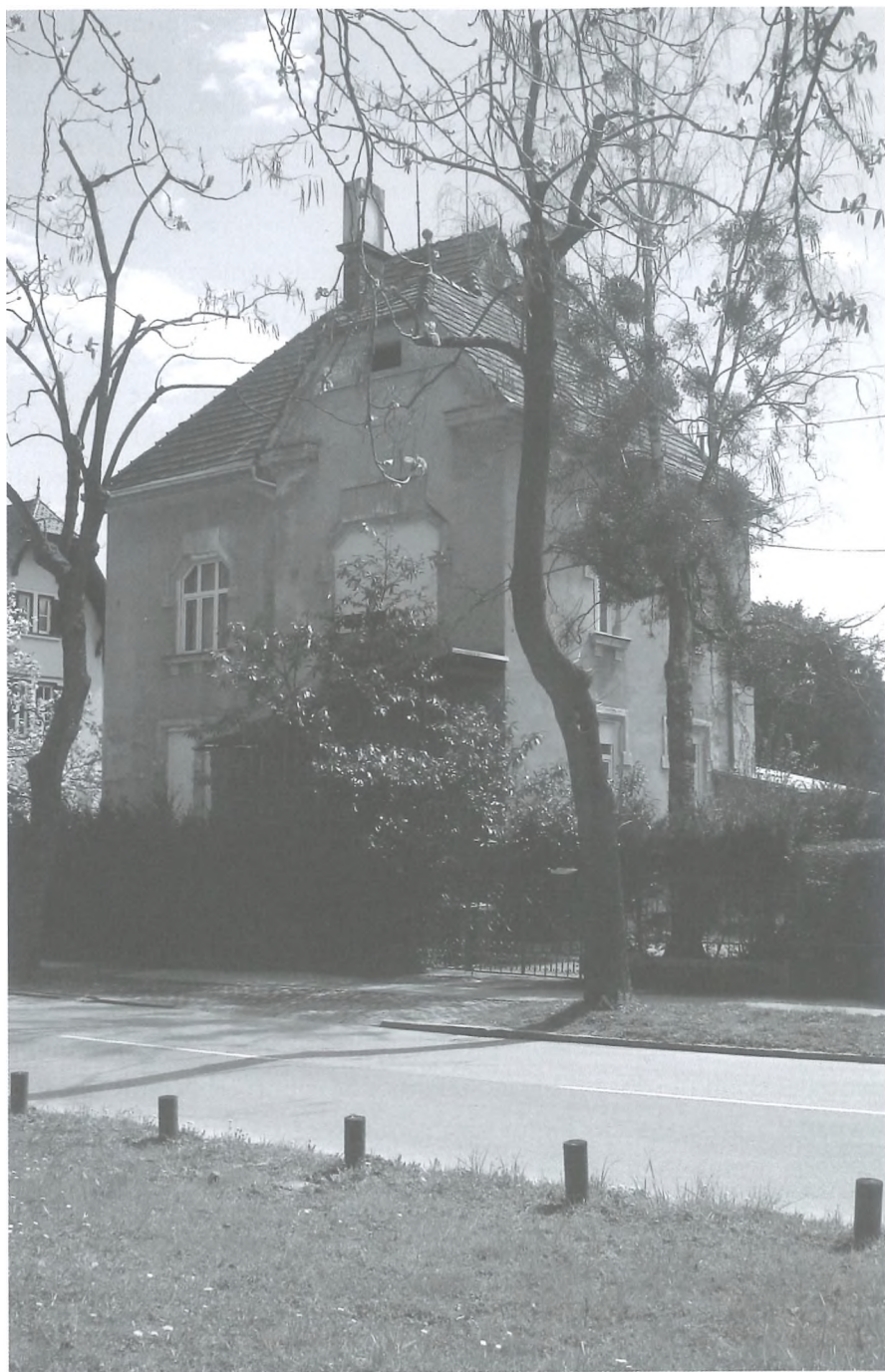
Nekdanja vila Štefana Kobylanskega v mariborskem Tomšičevem drevoredu