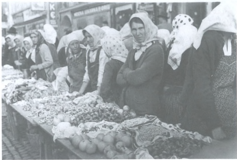
Utrip na mariborski tržnici med obema vojnama