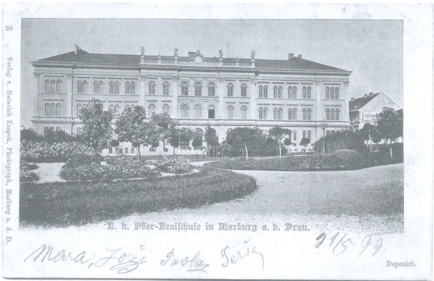
Mariborska realna gimnazija pred prvo svetovno vojno