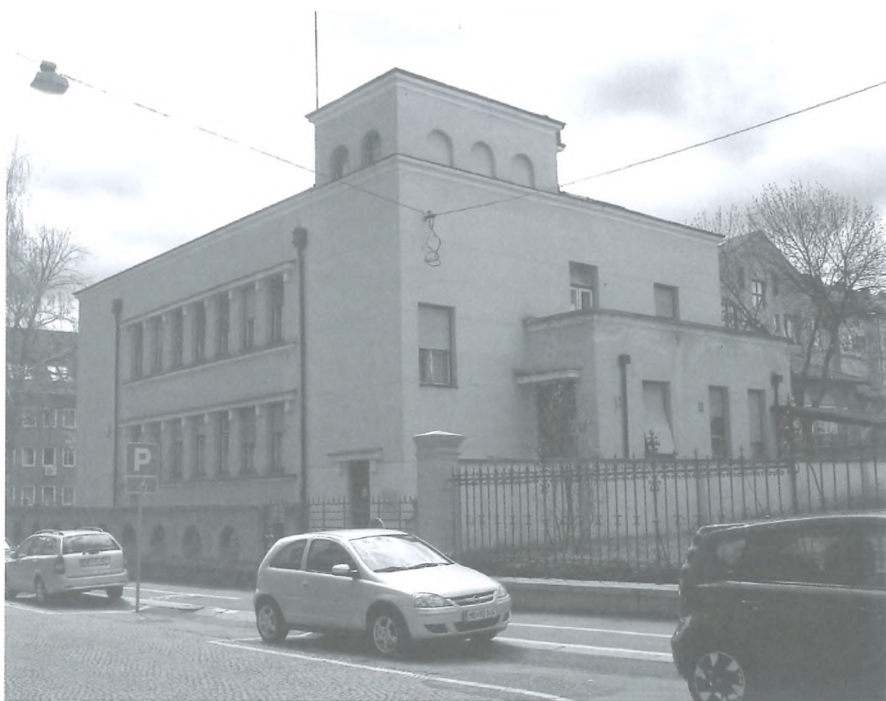
Nekdanji Cerničev sanatorij (foto: Mateja Ratej, april 2015)

teozof, poleg tega se je ukvarjal s prevajanjem iz nemščine ter učenjem slovenščine in srbohrvaščine. Zlasti v zimskem času po cele dneve ni zapuščal svoje sobe. Takoj nato je dodala: » Že od nekdanj je nagle jeze, če se mu v takem štadiju oponira, naraste njegova razdraženost do besnenja. « 68