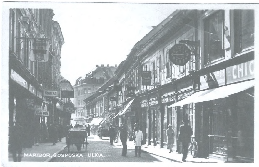
Maribor, slikovita Gosposka ulica leta 1929 (PAM, Zbirka fotografij in razglednic, inv. 2667)

moralistov z zanesljivimi koraki prihajala v Maribor tudi moda barvanja ženskih nohtov. 95 Hitro spreminjajoča se družba, vključujoč na glavo postavljene odnose med spoloma, je zakoncema Tofan vse bolj zapletala svet. 96 Zapiranje v mikrookolje stanovanja je bila nujna posledica države, ki ni želela ali zmogla v korak s časom in je zato postajala iz dneva v dan bolj bolna.