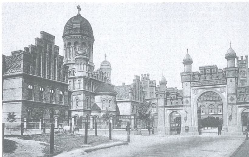
43 Erzbischöfliche Residenz.