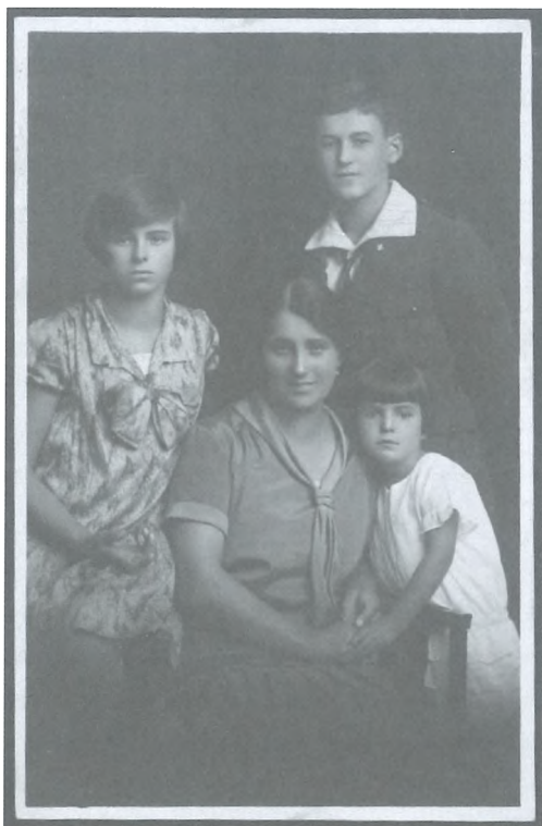
Mariborska družina v fotografskem ateljeju; ženski del družine je postrizen na bubikopf.