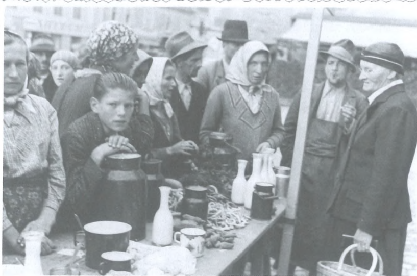
Utrip mariborske tržnice med obema vojnama

Zaloge premoga so bile skorajda v celoti namenjene železnici, gospodinjstva pa so se morala znajti po svoje. Pomanjkanje, ki je preseгло celo razmere med prvo svetovno vojno, je prebivalce mesta nagnalo v gozdove bližnje mariborske okolice, kjer so nabirali suhljad za kurjavo. 22 Zamrznjene vodovodne cevi, prazni mestni trgi in lačne divje zveri, ki so silile v obljudena območja, so prebivalcem zbujale misli o apokalipsi. 23 Morebiti je kdo razloge za hudo zimo na tihem povezal s političnimi razmerami v državi, javno in na glas kaj takega ni bilo mogoče.