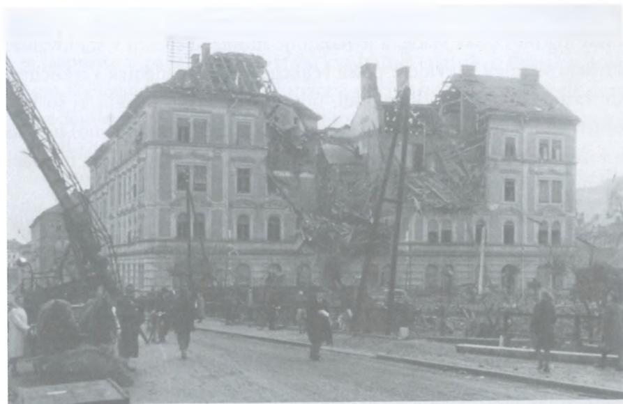
Marijina ulica 10 – v zavezniškem bombardiranju med 2. svetovno vojno močno poškodovana stavba, v kateri sta v dvajsetih letih 20. stoletja živela zakonca Tofan