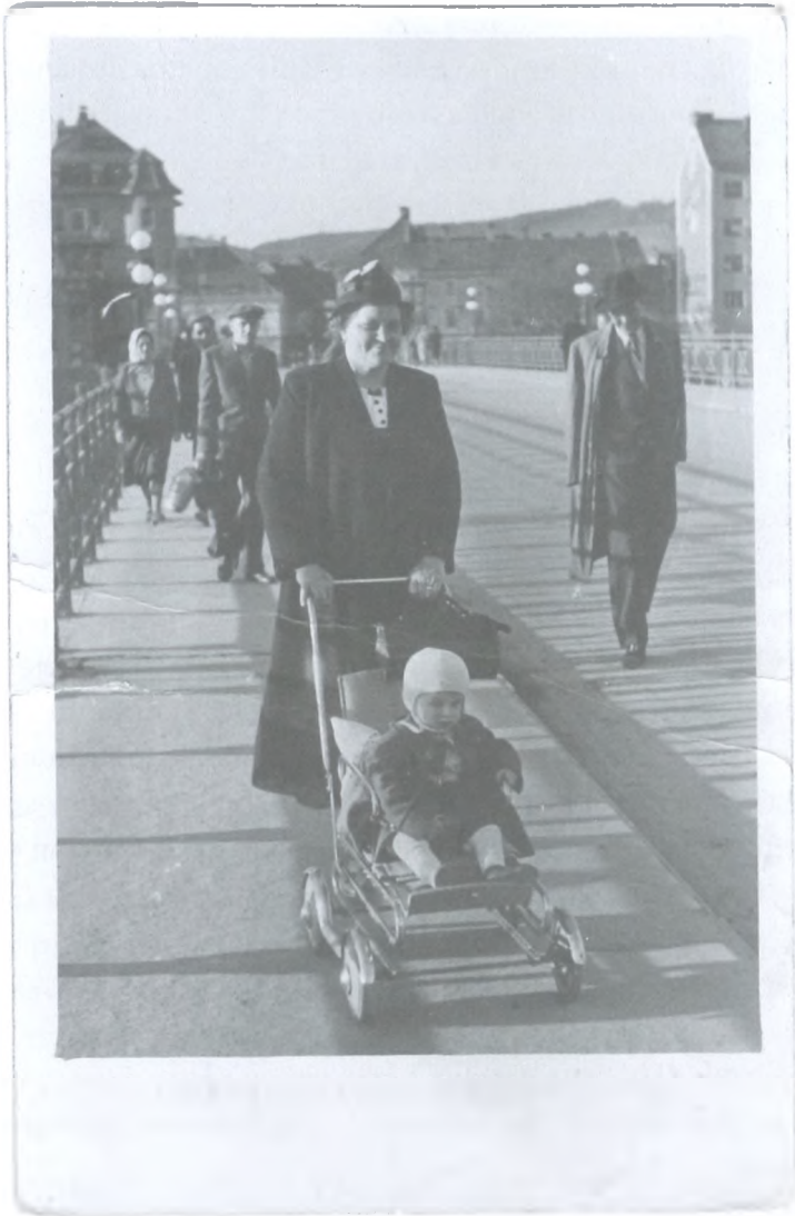
Med obema vojnama je pešce na dravskem mostu pričakal brzoslakač

upadel vodostaj reke Drave. Namesto pričakovane debele plasti ledu so se posamezne ledene plošče grozeče poganjale od ene do druge ovire. 25