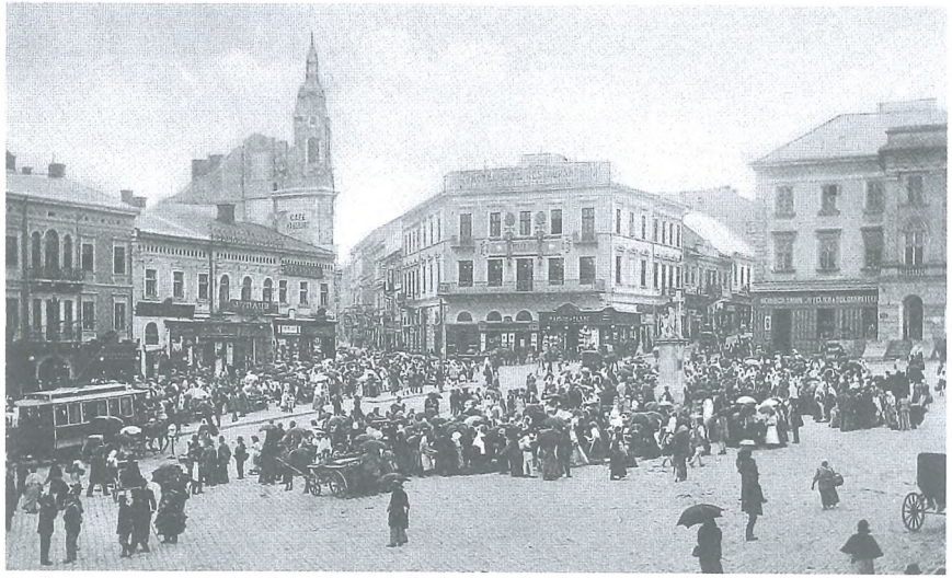
8 Ringplatz mit Café Habsburg, Hotel Bellevue und Rathaus.