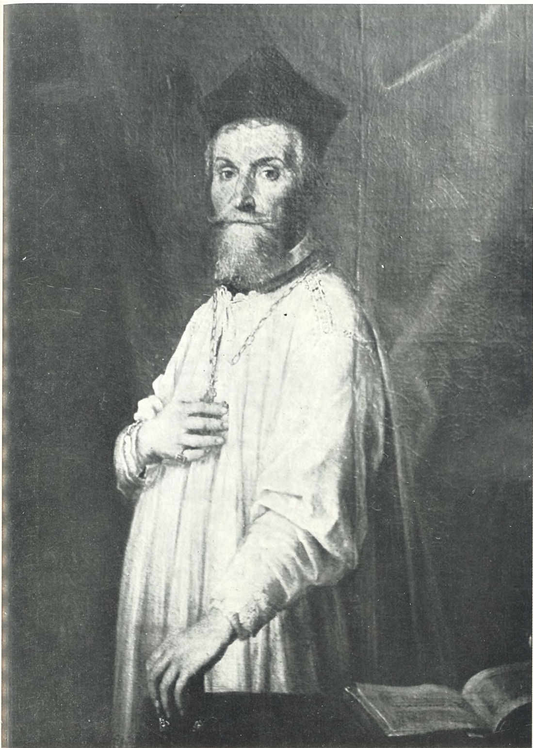
I. Tomaž Hren leta 1611 (olje, Nadškofijski ordinariat v Ljubljani)