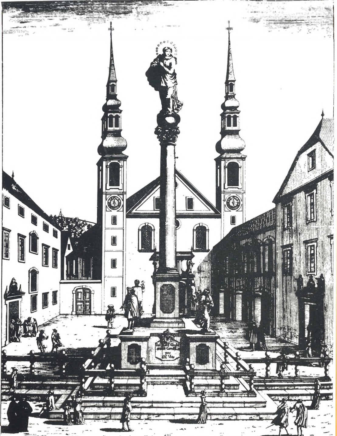
Dieß Delination von der Statua Unserer Lieben Frauen immaculatae Concep. Welche die Nob. Landschafft in Krain hat ex voto in der Haupt- statt Laybach Vor der Kirchen der S. J. P. Societ. im 1602. Jahr aufrichten lassen. In Krain Landt gehörsambst. Deßirre. In Frant. Jo: Wagnerszug in Carni.