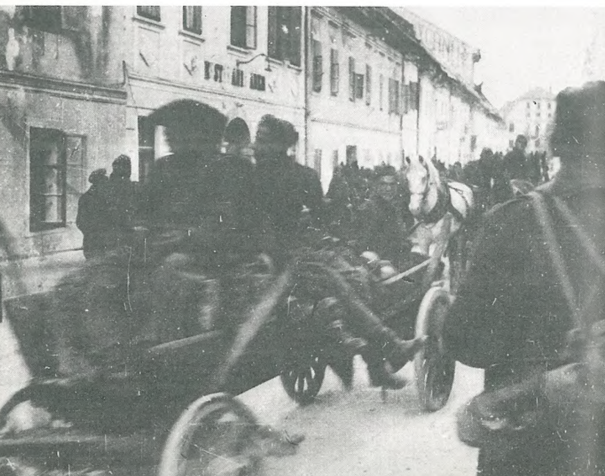
Prihod v Ribnico 6. maja 1945