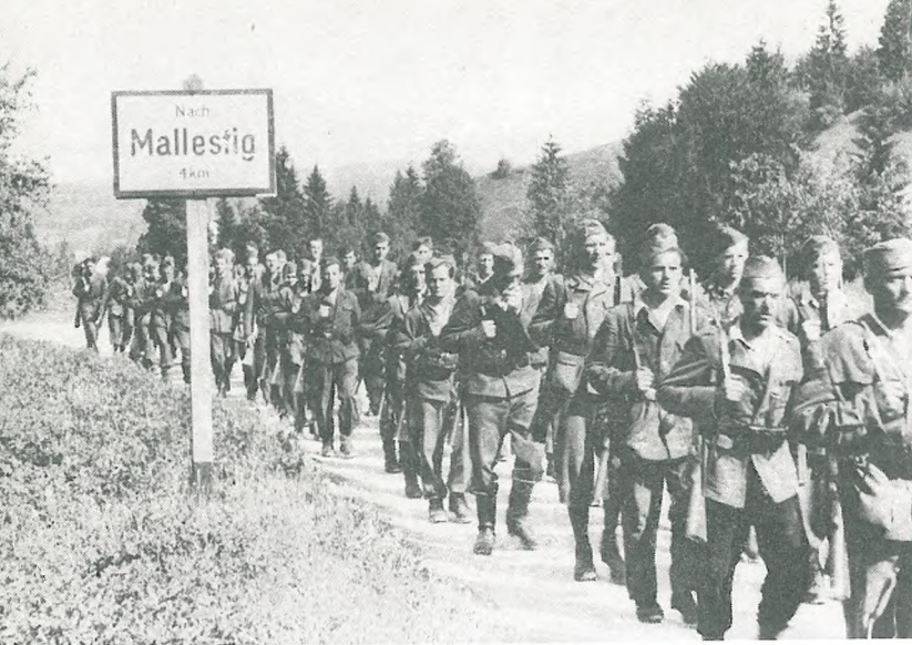
Jeseniško-bohinjski odred maja 1945 v Maloščah v Ziljski dolini