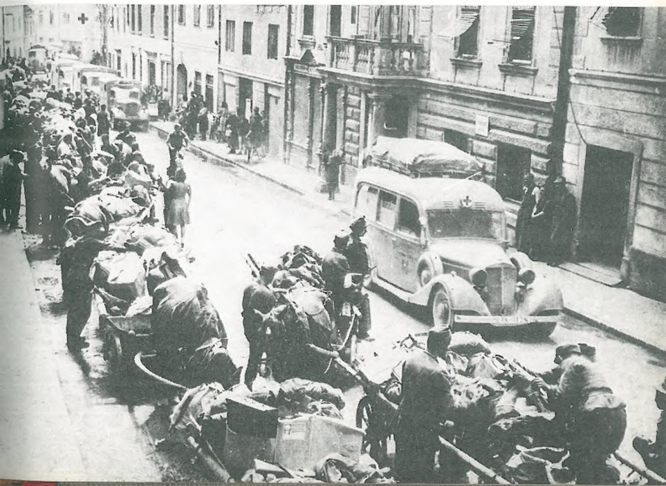
Beg okupatorjeve vojske skoz Tržič v maju 1945