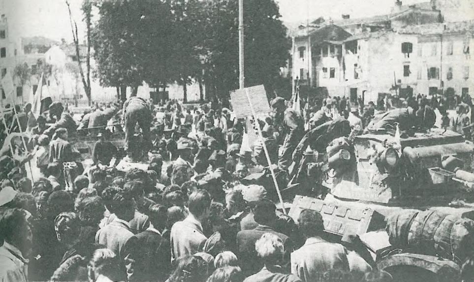
Manifestacije ob osvoboditvi Gorice