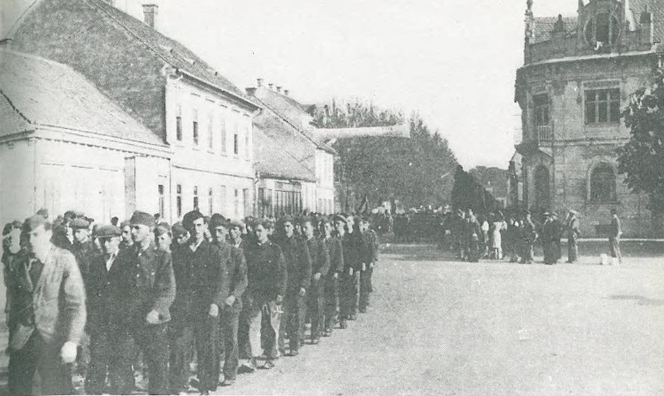
Nemški ujetniki v Murski Soboti 2. maja 1945