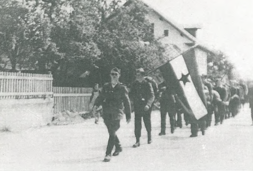
Borci Bohinjskega odreda v Bohinjski Beli 10. maja 1945

Okupator je na begu skoz Kranjsko goro 7. maja 1945 požigal hiše