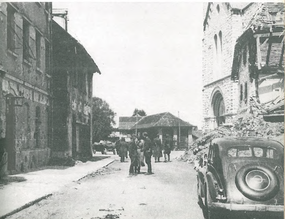
Kočevje ob osvoboditvi 4. maja 1945