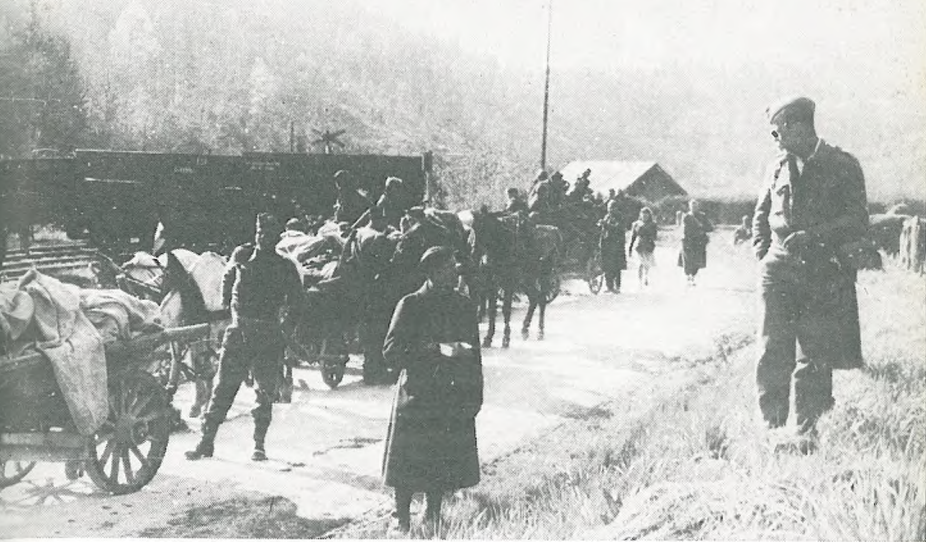
Kolona partizanov na poti proti Velikim Laščam v maju 1945