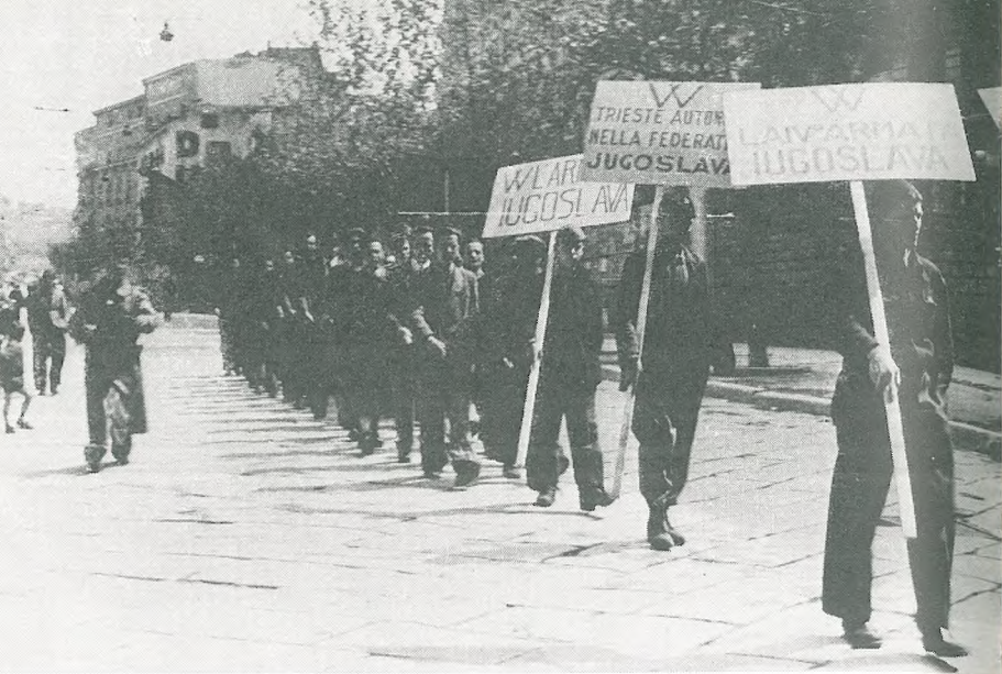
Trst po osvoboditvi