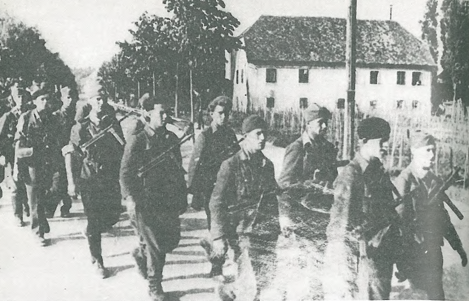
Partizanska vojska v Celju 9. maja 1945