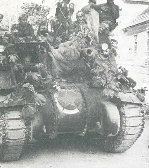
Prihod partizanske vojske v Novo mesto 10. maja 1945