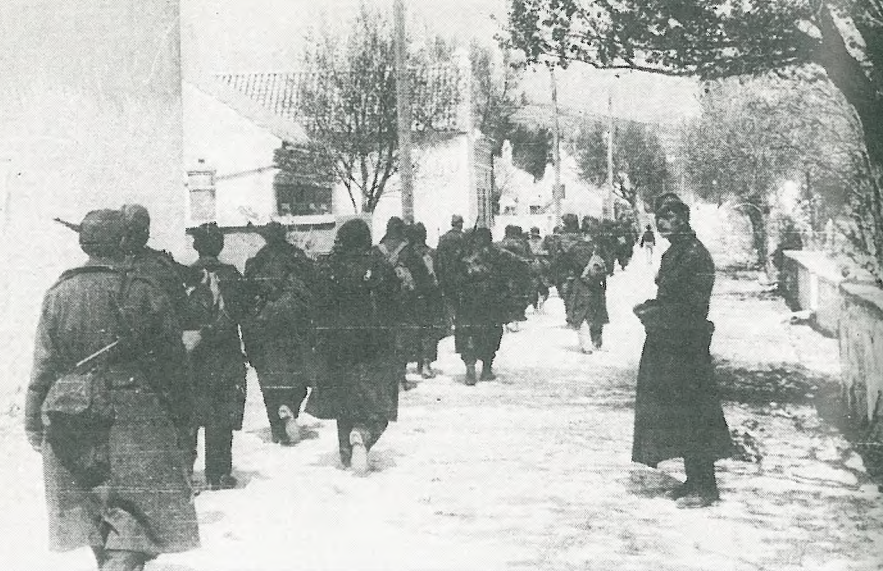
Osvobajanje Slovenskega Primorja