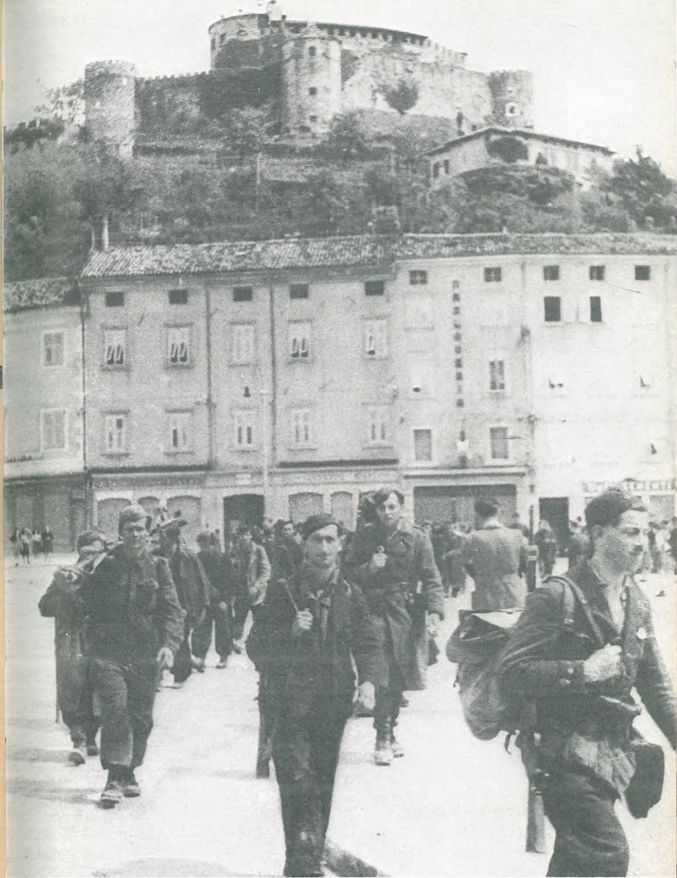
Prihod partizanske vojske v Gorico