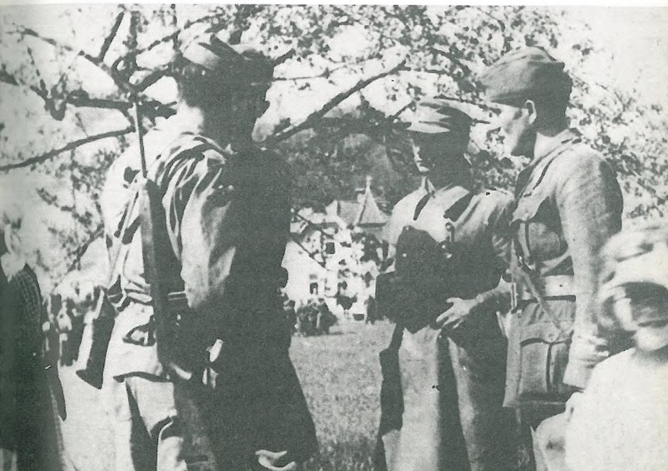
Kapitulacija Nemcev v Topolšici maja 1945