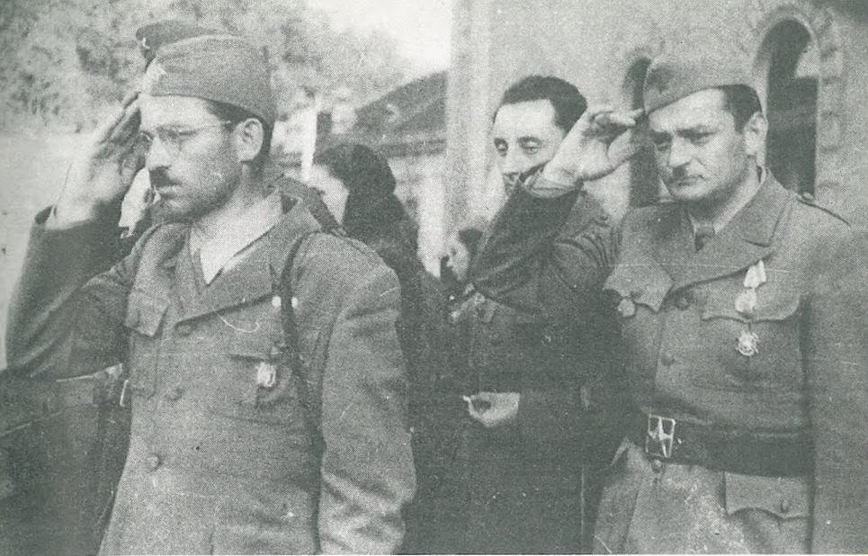
Sprejem prve slovenske vlade v Ljubljani 10. maja 1945