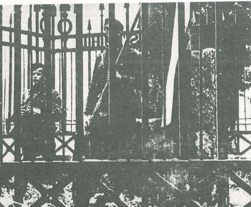
Partizanska straža ob vojvodskem prestolu na Gosposvetskem polju 15. maja 1945