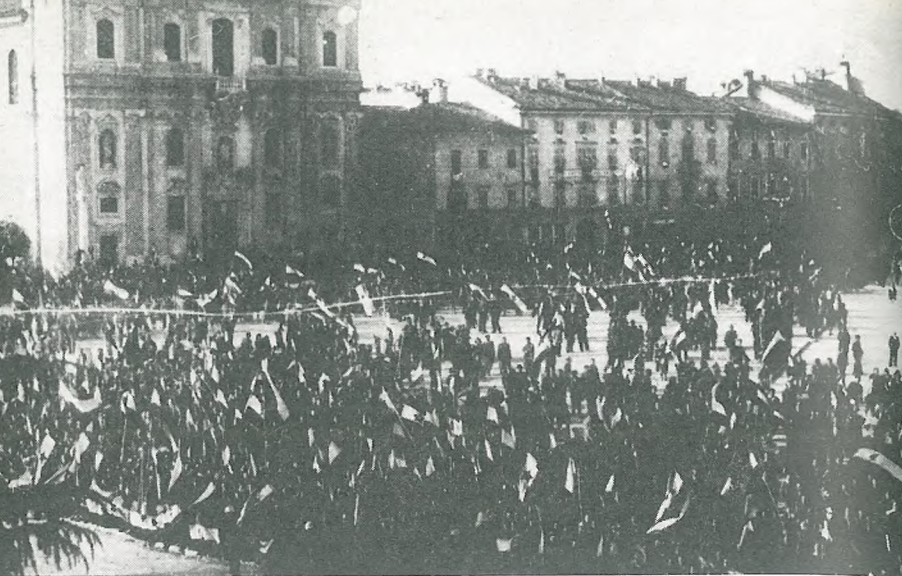
Gorica po osvoboditvi: manifestacije Kanalcev, Tolmincev, Vipavcev, Bricev za priključitev Slovenskega Primorja k Jugoslaviji