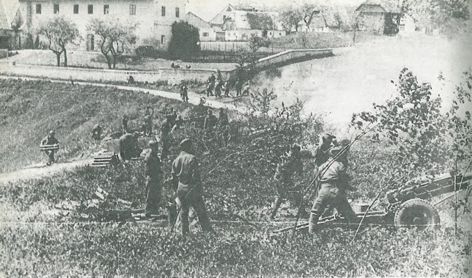
Poslednji boji za Ljubljano pri Grosupljem 6. maja 1945