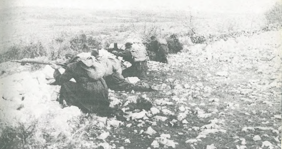
Boji na kopnem in na morju za dokončno osvoboditev Slovenskega Primorja in Trsta