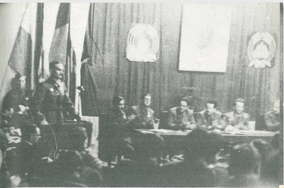
Prva slovenska vlada v Ajdovščini 5. maja 1945