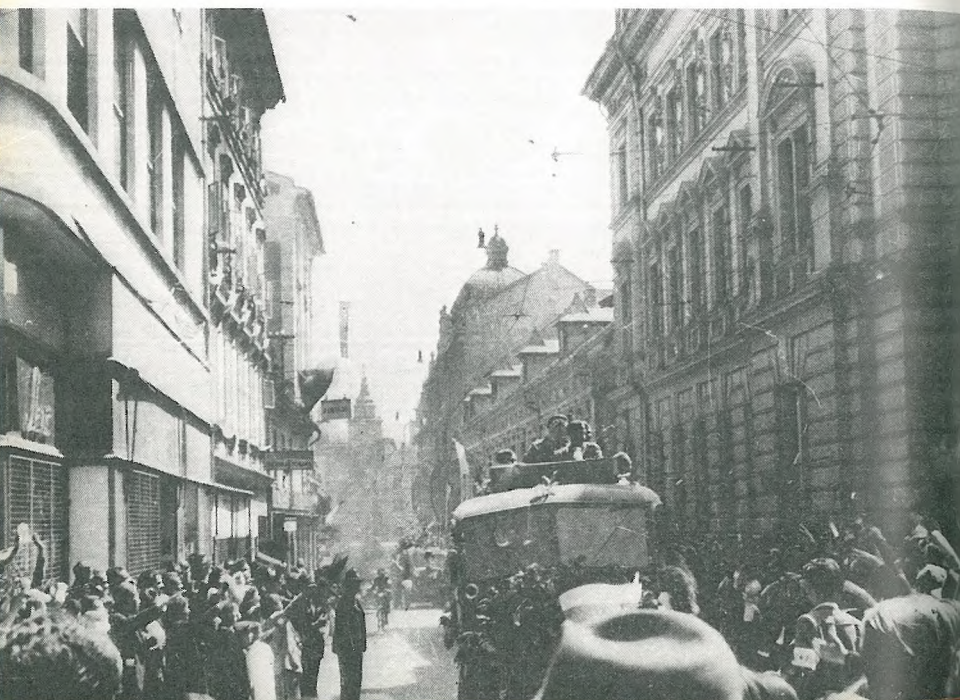
Osvoboditev Ljubljane 9. maja 1945