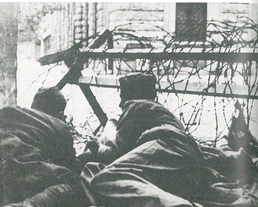
Poulični boji v Trstu