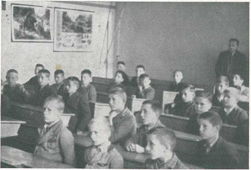
Eine Schulklasse bei der Arbeit