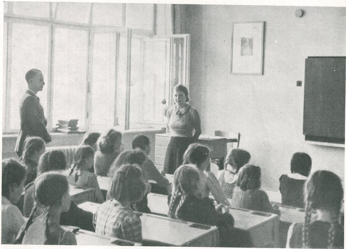
Der Gauleiter besucht eine Marburger Schule