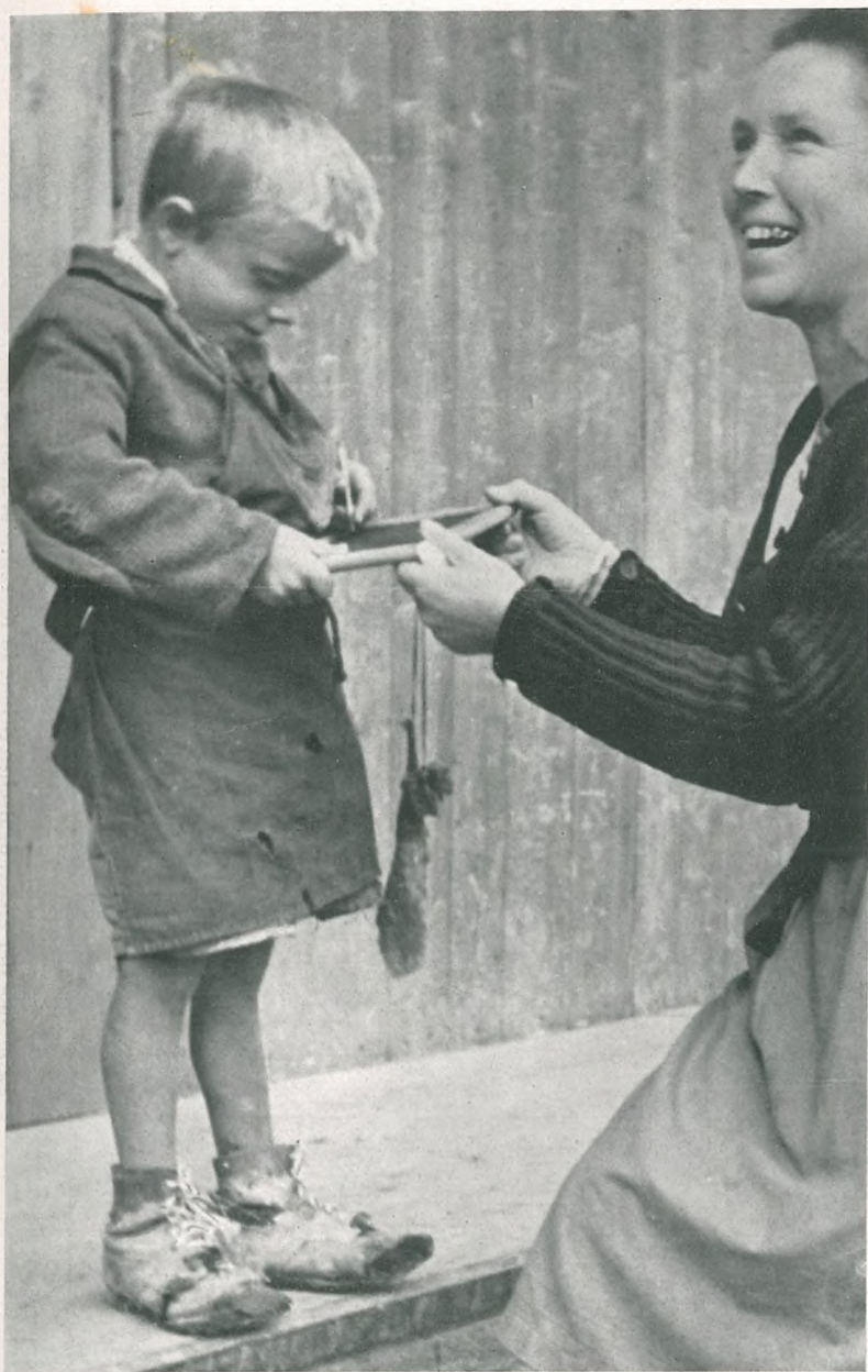
Das war der schwere Anfang