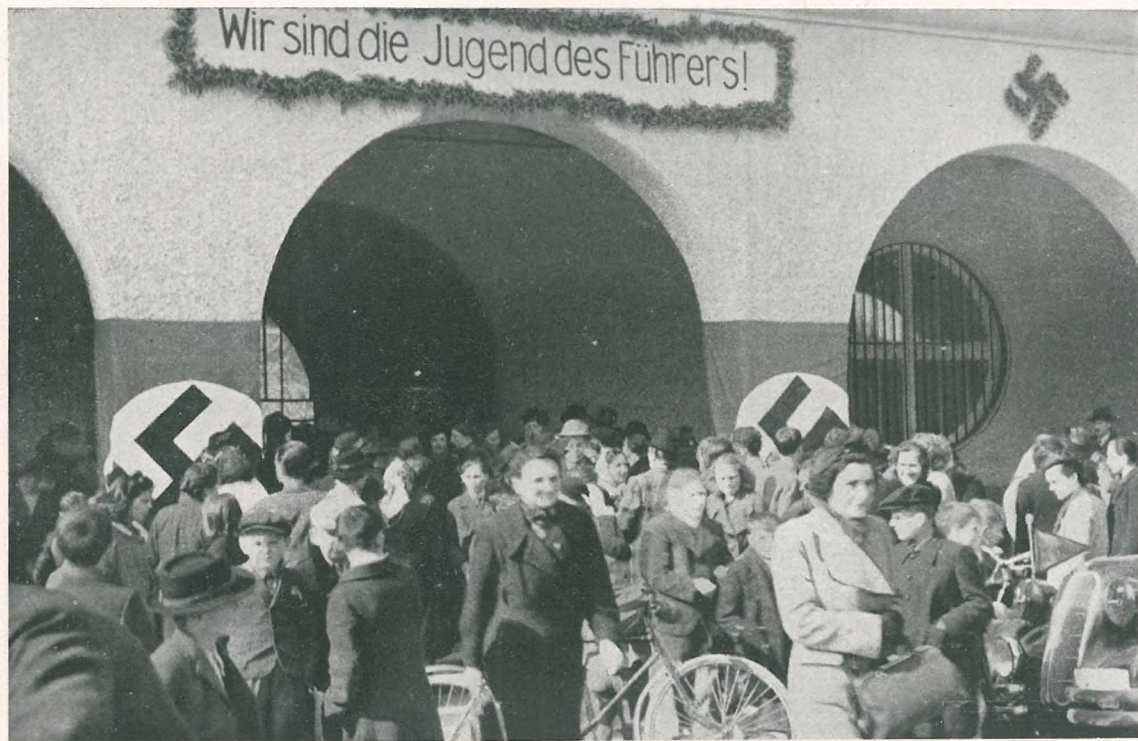
Eröffnung der ersten deutschen Schule in Marburg a. d. Drau