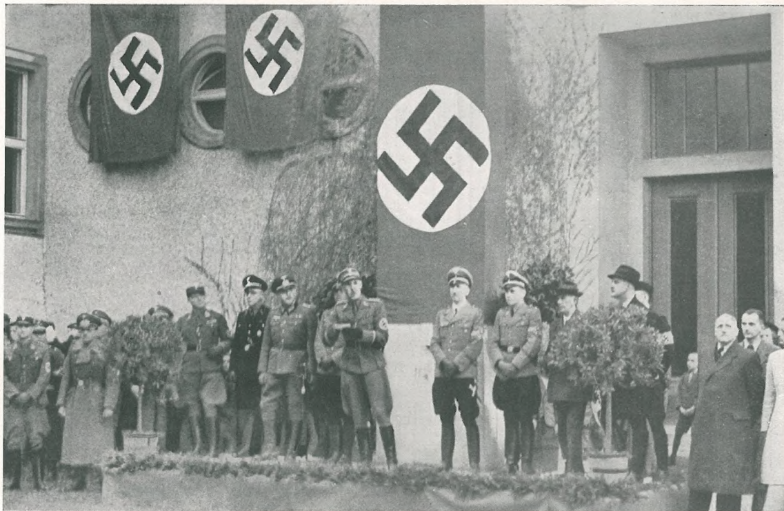
Der Bundesführer des Steirischen Heimatbundes Pg. Steindl eröffnet die erste deutsche Schule der Untersteiermark