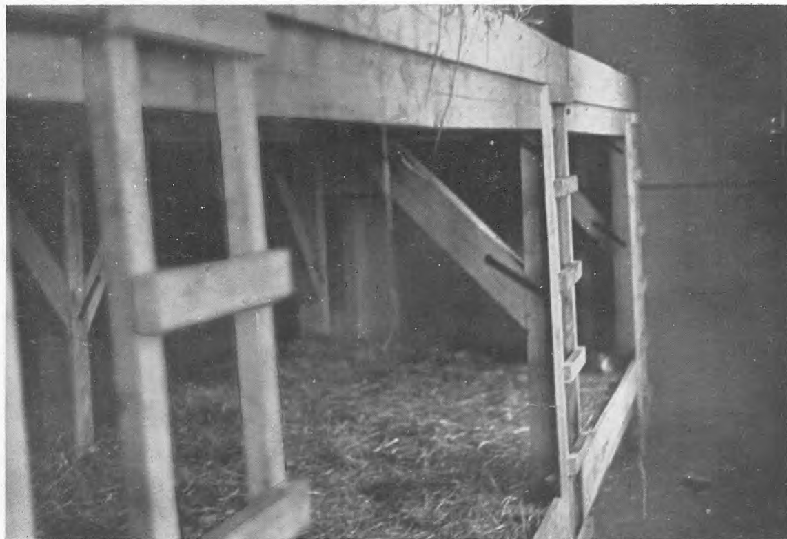
So sah die Schule in Thesen aus . . .