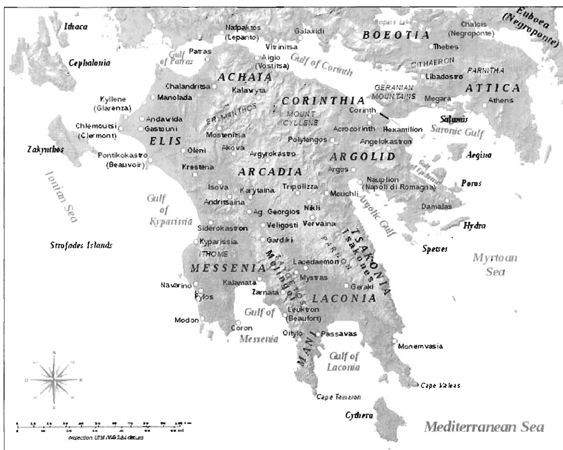
Zemljevid 1: Peloponez v času vladavine Latincev